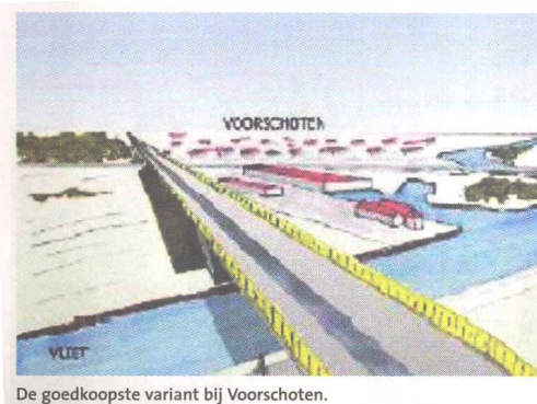
De goedkoopste variant bij Voorschoten.

De dure variant (196 miljoen) legt de Vliet in een aquaduct. Aan de Voorschotense kant ligt de