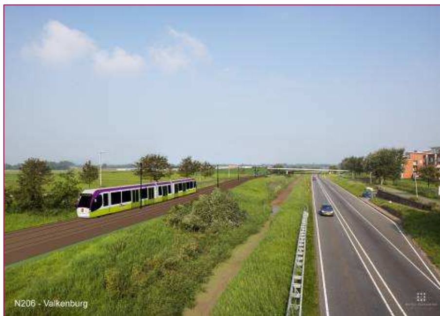
Figuur B1.5: RijnGouwelij, geprojecteerd aan de zuidzijde van de N206 (Royal Haskoning, 2009)

Ten aanzien het tracé, de halten en de frequentie van de RijnGouwelij is aangesloten bij de meest recente inzichten die hierover bestaan binnen de provincie Zuid-Holland.