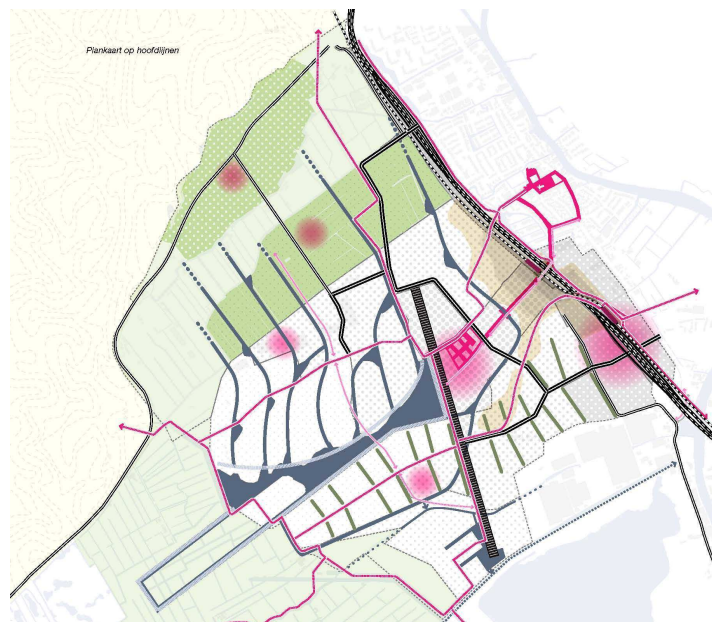
Figuur B1.1: Impressiekaart hoofdlijnen concept Masterplan Locatie Valkenburg (stand van zaken maart 2012)

Wat betreft de lokale ontsluitingsstructuur van Locatie Valkenburg is uitgegaan van het verkeersonderzoek in het kader van het Masterplan dat is opgesteld voor Locatie Valkenburg 1 . Hierin wordt een hoefijzervormige wegenstructuur voorgesteld, die aansluit bij variant 2a uit de studie infrastructuurzone Locatie Valkenburg 2 . De lokale ontsluitingsstructuur van Locatie Valkenburg is weergegeven in figuur B1.1.