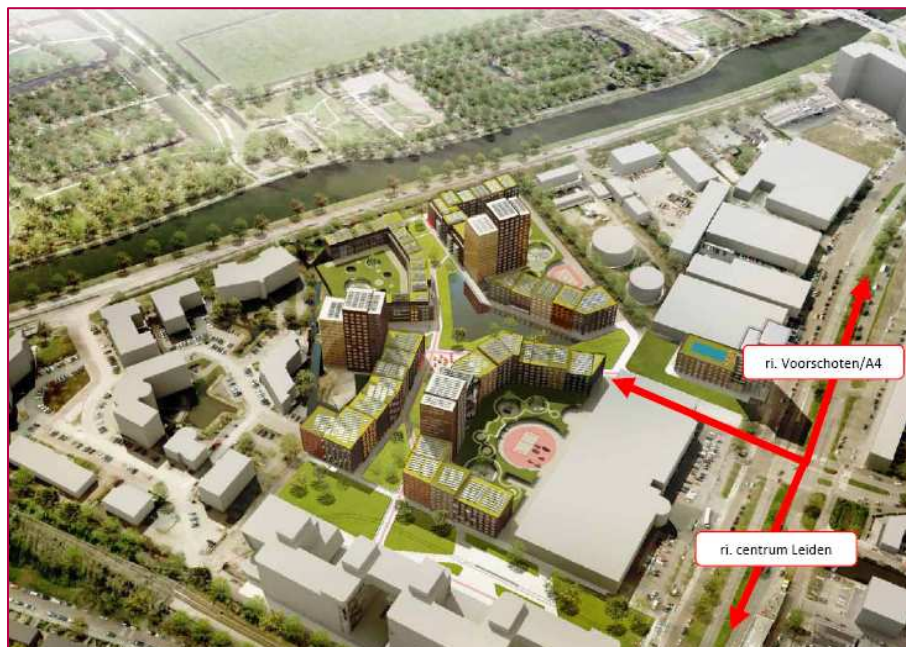
Figuur B1.4: Leidse Schans (bron: Oranjewoud, notitie Planontwikkeling De Leidse Schans, verkeersgeneratie planontwikkeling, 237826-20110803 - rev. 02, augustus 2011)