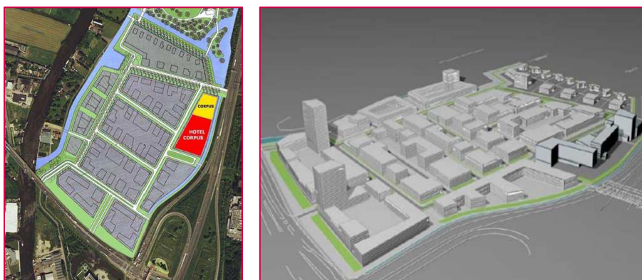
Figuur B1.3: Nieuw-Rhijneest Zuid (voorontwerp bestemmingsplan, Bureau Beeld, september 2009)

Voor Nieuw-Rhijneest Zuid is bestuurlijk vastgelegd dat het plangebied rechtstreeks vanaf de N206 dient te worden ontsloten. In alle tracéalternatieven en varianten is hieraan invulling gegeven, rekening houdend met de vormgeving van de Knoop Leiden-West. Daarnaast is uitgegaan van een secundaire ontsluiting via de Verlengde Wassenaarseweg richting Oegstgeest. Hierbij is ervan uitgegaan dat doorgaand verkeer geen gebruik maakt van deze verbinding.