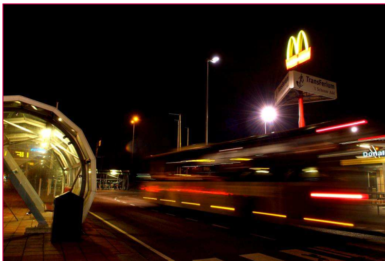
Figuur B1.6: Transferium 't Schouw A44

De ontsluiting van transferium 't Schouw A44 hangt samen met de ontsluiting van Nieuw-Rhijngest Zuid en Leiden Bio Science Park. In het statische verkeersmodel is het transferium niet opgenomen. In het dynamische verkeersmodel en in de ontwerpen is wel rekening gehouden met een transferium.