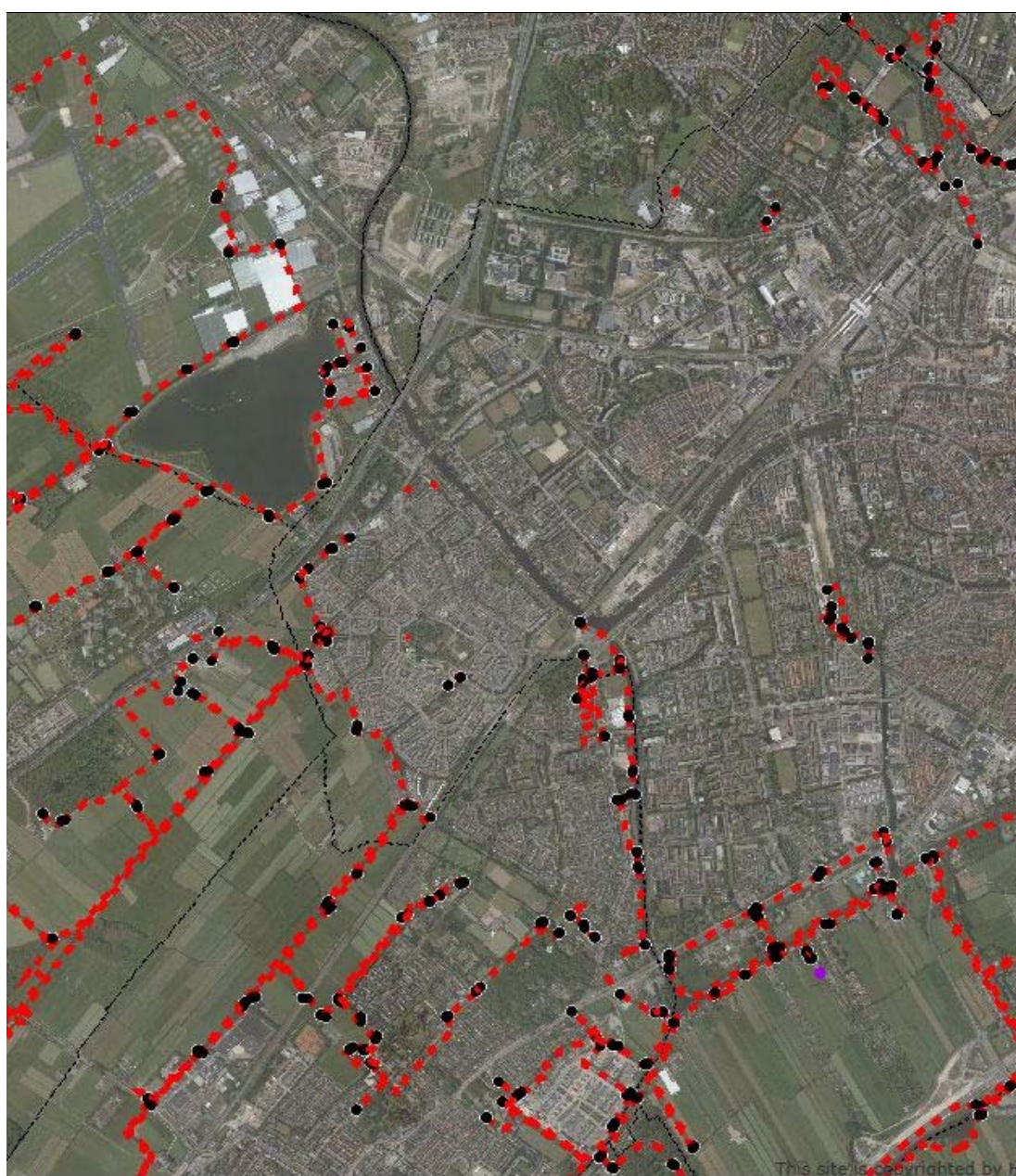
Figuur 3.1 Ligging van de keringen in het studiegebied. De keringen zijn digitaal te raadplegen in de legger van Hoogheemraadschap van Rijnland ( www.rijnland.net ).