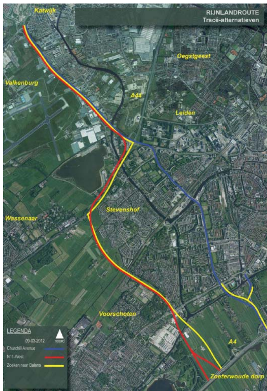
Figuur 2.1 Tracéalternatieven (plangebied) inclusief topologie.