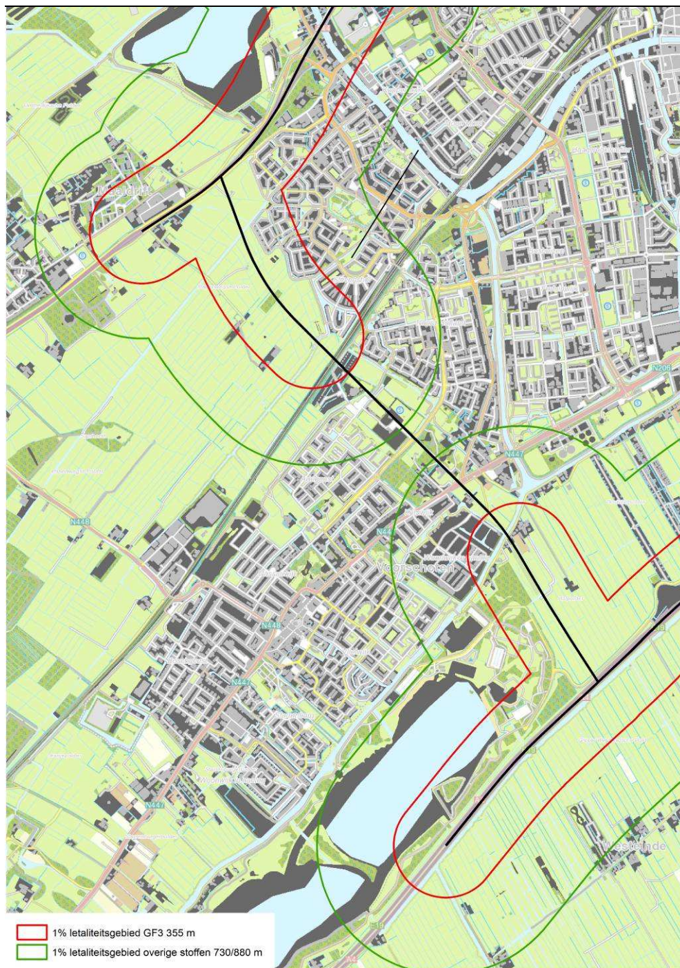
Figuur 3.1 Effectgebieden