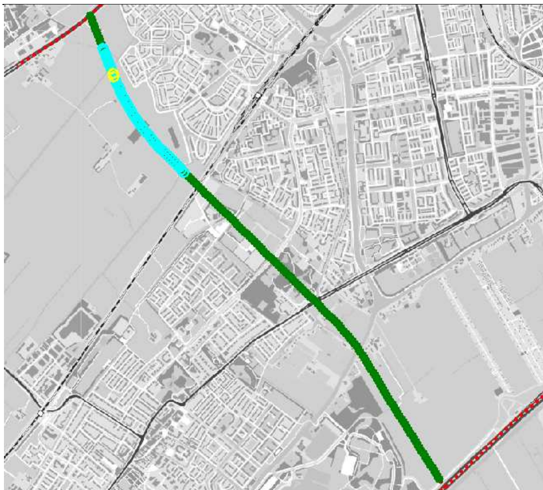
Figuur 3.3 Kilometer met het hoogste groepsrisico (blauw) op de nieuwe verbindingsweg tussen de A4-A44