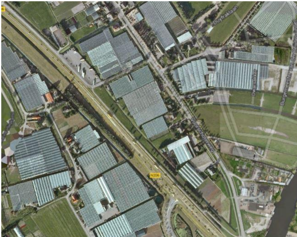
Afbeelding 1.1. Luchtfoto van de locaties (rood=alternatief, blauw=bestaand)