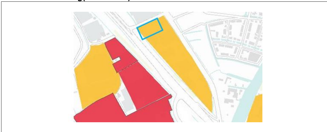
Afbeelding 2.1. Alternatieve locatie van het tankstation (blauwe kader) en archeologische waarde uit de cultuurhistorische kaart (geel=hoog, rood=zeer hoog(beschermd))

Op de alternatieve locatie is de zogenaamde 'Limes verordening' van toepassing. Dit is een regeling voor de Romeinse Limes, die is opgenomen in de structuurvisie en de bijbehorende Verordening Ruimte van de provincie Zuid-Holland 2 .