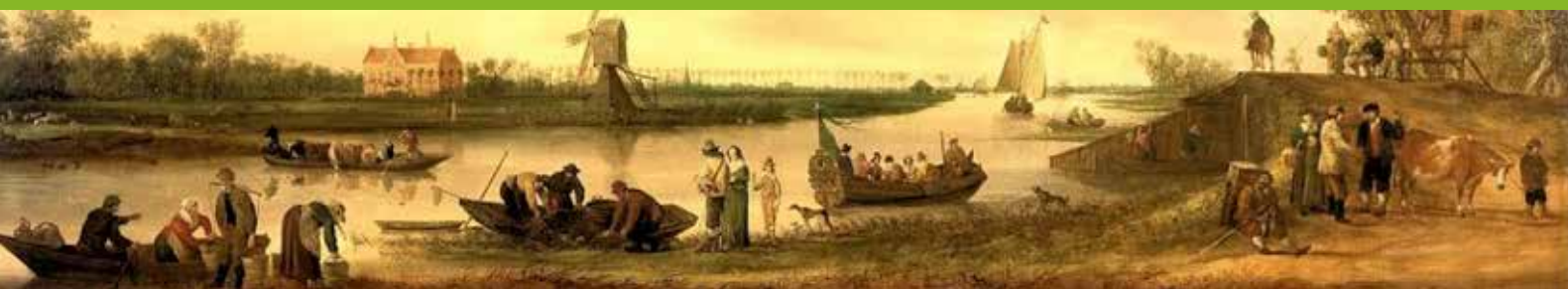
Jan van Goyen (1642): gezicht op Oostbosch vanaf de Vliet

Waarom is deze Duivenvoordecorridor zo belangrijk? Dit gebied, begrensd door de spoorlijn in het westen, de bebouwing van Leidschendam in het zuiden, de Vliet (Rijn-Schie kanaal) in het oosten en de bebouwing van Voorschoten in het noorden, is om en nabij de twee bij één kilometer. Deze twee vierkante kilometer geven nog een goed (cultuur) historisch beeld van de vorming van dit unieke strandwal/strandvlakte landschap en zijn bewoners in de loop der eeuwen. Daaraan zijn specifieke cultuurhistorische en natuurwaarden verbonden, zie kaders.